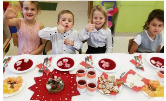
Włosienica - Wigilia