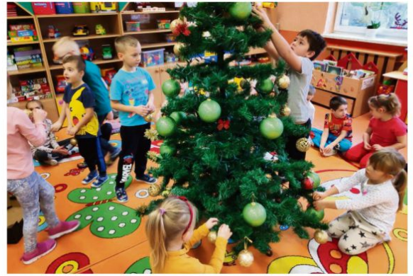
Rajsko - ubieranie choinki

Uroczystości i święta, które są w kalendarzu od zawsze, to nie wszystko. W każdej placówce dzieją się rzeczy wyjątkowe i niepowtarzalne; programy i innowacje stworzone albo zaadaptowane do własnych potrzeb. "Przedszkolak bezpieczny na drodze", "Cenimy