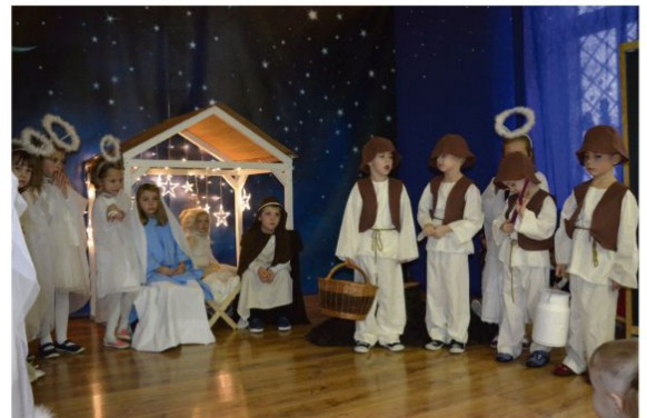
Zaborze - Jasełka