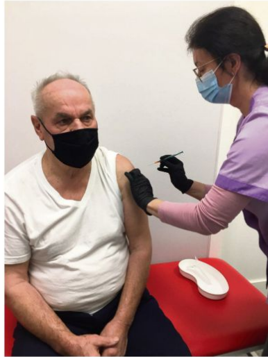
opr. LCh

8 lutego 2021 r. rozpoczęły się zapisy na szczepienia dla nauczycieli szkół klas I-III, nauczycieli przedszkoli oraz pełniących funkcje pomocy do dzieci. W pierwszej turze (do 10 lutego) 95 osób z gminnych placówek oświatowych wyraziło chęć zaszczepienia się przeciw COVID-19 (65 ze szkół i 30 z przedszkoli).