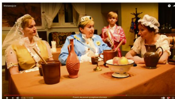
„Wstawajcie!” - film do obejrzenia w internecie

Jeśli sytuacja epidemiczna na to pozwoli, w drugiej połowie roku możemy