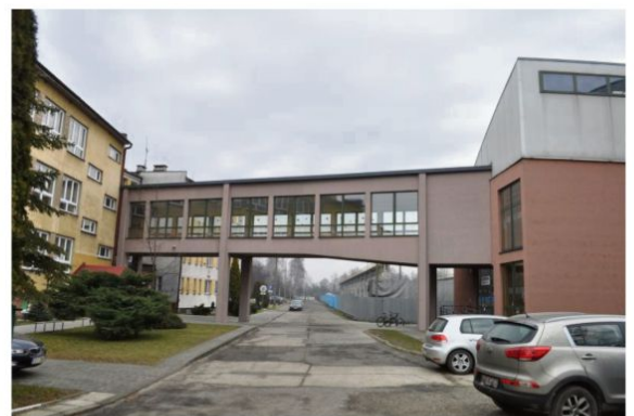
Rajsko, ul. Edukacyjna.