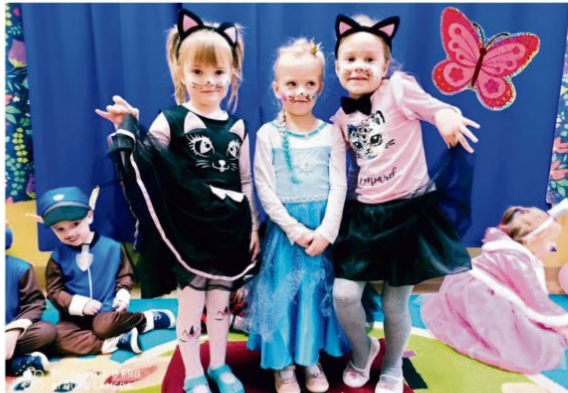
Grojec - bal karnawałowy