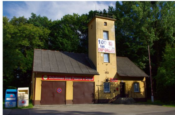
Remiza w Grojcu.

Siedziba projektowej straży pożarnej czeka na rozbudowę co najmniej od dekady. 10 lat ma projekt jej rozbudowy.