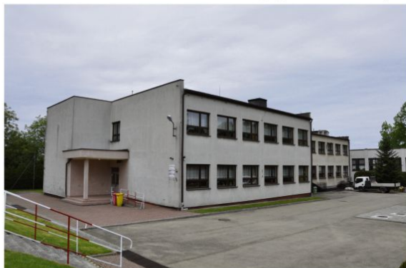
Szkoła w Grojcu.

Ten budynek jest dużo młodszy. Powstał na przełomie lat 80. i 90. Jednak pod względem liczby uczniów szkoła w Grojcu jest obok zaborzkiej podstawówki jedną z największych w naszej gminie. Około trzystu