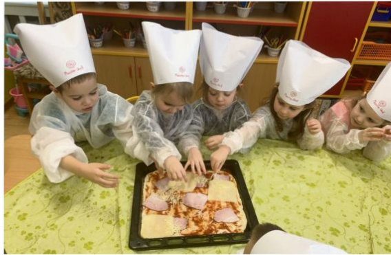
Brzezinka - dzień pizzy