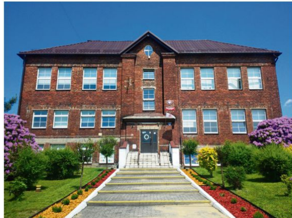
Szkoła we Włosienicy.

trzeba też zapewnić odpowiednią sumę pieniędzy jako własny wkład finansowy. Ale bez zewnętrznych środków – w ostatnich dwóch latach są to głównie państwowe dotacje – niewiele da się zrobić.