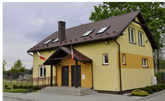
Siedziba LKS Poręba Wielka przy ulicy Wykręt.

Trwają ustalenia i rozmowy na temat starej szkoły. Rozważane jest utworzenie w pałacu domu opieki dla seniorów lub niepublicznego przedszkola integracyjnego. W tegorocznym gminnym budżecie na opracowanie doku-