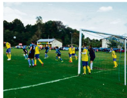
Od 12 lutego piłkarskie drużyny z niższych lig mogą oficjalnie trenować i rozgrywać mecze towarzyskie.