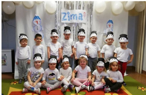
Poręba Wielka - biały dzień

Niemniej liczba dzieci przeprowadzanych na zajęcia jest podobna jak ubiegłej zimy, a w Grojcu nawet wyższa. To świadczy nie tylko o tym, jak te placówki są potrzebne, ale też o zaufaniu, jakim rodzice darzą pracowników przedszkoli. Równocześnie koronawirus się nie rozprzestrzenił, co z kolei pokazuje, że przestrzeganie sanitarnych rygorów przynosi skutki.