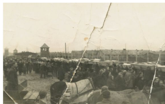
Pogrzeb więźniów.

Na internetowej witrynie Muzeum Pamięci Mieszkańców Ziemi Oświęcimskiej powstał specjalny dział, którego tematem jest 27 stycznia 1945 roku.