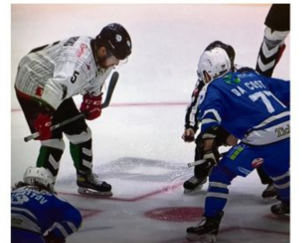
Faza play-off w hokejowej ekstraklidzie zapowiada się ekscytująco. Czy na medal spisać się oświęcimianie?