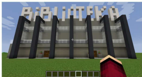
Praca - Jakub Krawczyk klasa 1b