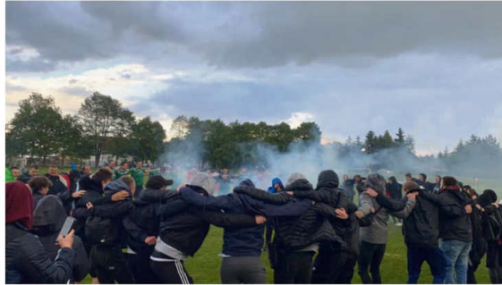
Piłkarze i kibice Iskry Brzezinka świętują awans do klasy A po zwycięstwie nad obiektem Korony Harmężę.