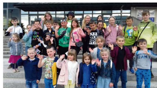
Młodzi mieszkańcy Stawów Monowskich.

Przed południem 1 czerwca dzieci odwiedził wójt Mirosław Smolarek z bagażnikiem pełnym lakości. Częstował maluchy