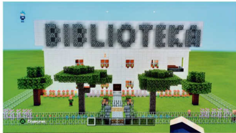
Praca - Alan Bróda klasa 2b

To wspaniałe doświadczenie zwiedzać tak różnorodne biblioteki. Widać w nich inspirację bibliotekami, które odwiedzają na co dzień, biblioteką szkolną, biblioteką publiczną. Bo przecież biblioteka to miejsce które