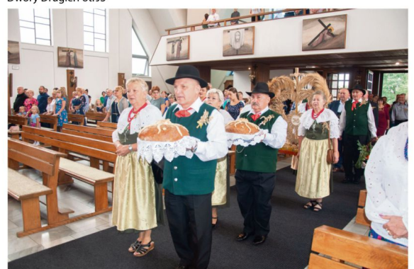
Rajsko.