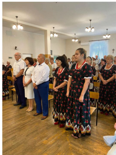
Dwory Drugie.

Mieszkańcy najmniejszego sołectwa gminy Oświęcim uczli Dożynki 27 sierpnia połowym dziękczynnym nabożeństwem odprawionym w Domu Ludowym. Szczególnym momentem mszy było poświęcenie plodów ziemi i odnowionej figurki z kapliczki, która jest wyjątkowym miejscem dla mieszkańców Dworów Drugich. Po ceremonii na świętujących czekał poczęstunek: prażone i ciasto.