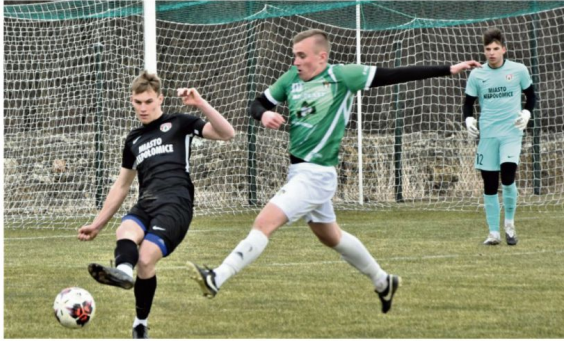
Rajsko odniosło cenne zwycięstwa nad zespołami Brzeziny Osiek i Babiej Góry z Suchej Beskidzkiej.

Najpierw zatrzymali rozpedzoną Brzezię Osiek dla której była to jedyna porażka w pięciu pierwszych meczach. LKS Rajsko zwyciężyło 3:2. Wynik spotkania otworzył tuż przed przerwą Mika, zamieniając na gola „jedenastkę”. Zaraz po przerwie goście z Osieka także skutecznie egzekwowali karne, a po kolejnych 120 sekundach objeli prowadzenie. Końcówka należała jednak do Rajska, a w roli głównej wystąpił Patryk Ryszka. W 80 minucie