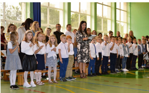
Słobowanie pierwszoklasistów we Włosienicy.