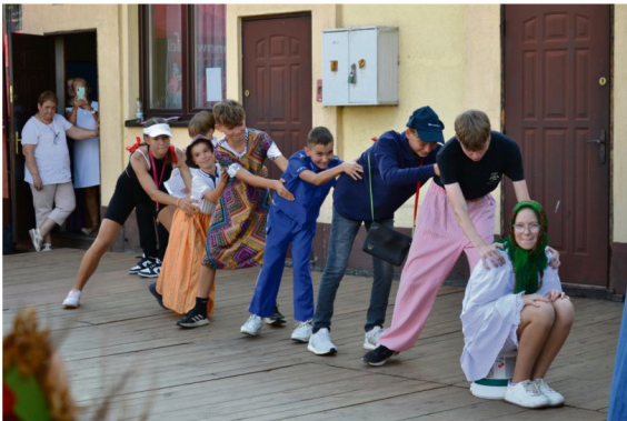
Stawy Monowskie.