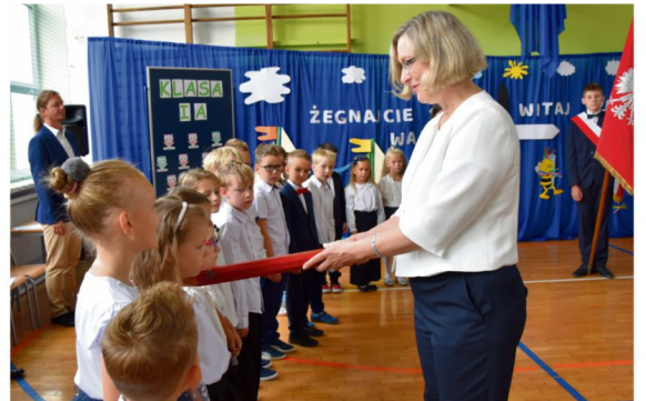
Pasowanie nowych uczniów w Brzezince.

Wójt gminy Oświęcim życzył zgromadzonym uczniom i nauczycielom wszystkiego najlepszego oraz tego, aby nowy rok szkolny obfitował w sukcesy i rozwój. Podkreślił, że szkoła w Brzezince po zakończeniu remontu