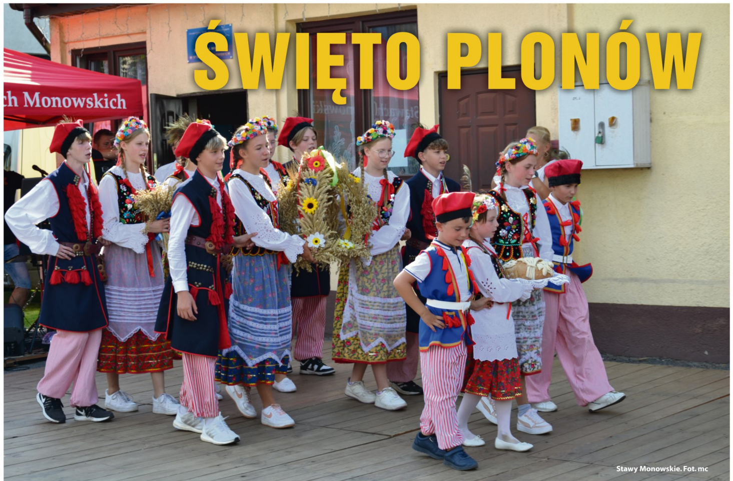
Stawy Monowskie.

Tego lata dożynkowe uroczystości zorganizowali mieszkańcy dziewięciu miejscowości gminy Oświęcim. Obchody przekraczały granice sołectw, bo wśród uczestników byli sąsiedzi, współparafianie, a także przedstawiciele samorządowych i krajowych władz.