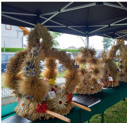
Na pierwszym planie nagrodzony wieńiec KGW Babice