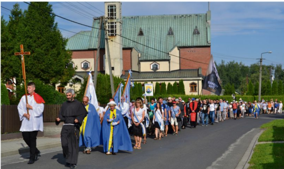
Pielgrzymka wiernych w Harmężach 14 sierpnia.