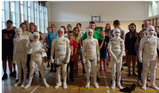
Konkurencja "Mumia" to okazja do zabawy i zarazem nauka bandażowania.

W czasie obozu rodzice mogli codziennie z mediów społecznościowych dowiedzieć się, jak przebiega szkolenie, bo tradycyjnie uczestnicy