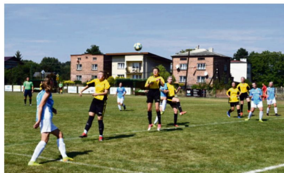
Iskierki zakończyły tegoroczną przygodę z Pucharem Polski i pozostają im już tylko ligowe obowiązki.

pokonała w Szaflarach miejscową Akademię Piłkarską 1:21. Awans do najlepszej „czwórki” w województwie